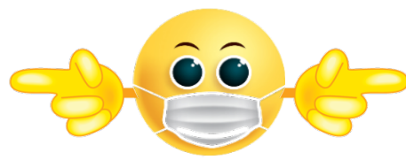
No toques tu cara