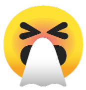
Cubre tus toses y estornudos