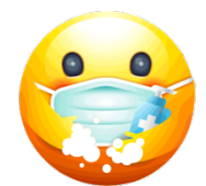
Lávate las manos