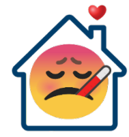
Quédate en casa si estás enfermo