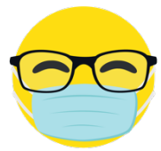
Usa tu máscara de tela